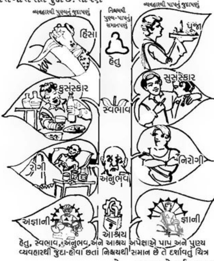
હેતુ, સ્વભાવ, અનુભવ અને આશ્રય અપેક્ષાએ પાપ અને પુણ્ય વ્યવહારથી જુદા-હોવા છતાં નિશ્ચયથી સમાન છે તે દર્શાવતું ચિત્ર છે.

પાપના ફળમાં રોગીષ્ટ દશા અને તેનું દુઃખ અને પુણ્યના ફળમાં નિરોગીદશા અને તેનું સુખ અનુભવાય છે. પણ વાસ્તવમાં કોઈ પણ કર્મના ફળનો અનુભવ દુઃખરૂપે જ હોય છે. કોઈ કર્મનું ફળ દુઃખ અને કોઈ કર્મનું ફળ સુખ જણાય તે