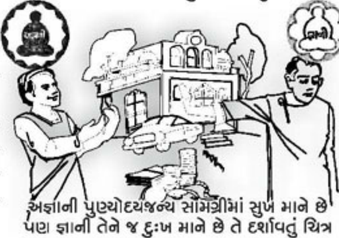
અજ્ઞાની પુણ્યોદયજન્ય સામગ્રીમાં સુખ માને છે પણ જ્ઞાની તેને જ દુઃખ માને છે તે દર્શાવતું ચિત્ર

અજ્ઞાની જીવને અનેક પ્રકારની ઈચ્છાઓ હોય છે. આ ઈચ્છાઓની પૂર્તિ કરવા માટે તે પુણ્યના ઉદય અનુસારની પ્રવૃત્તિમાં જોડાઈ છે. તેનાથી શરૂઆતમાં તો તેને ભ્રાંતિથી ઈચ્છાની પૂર્તિ થતી જણાય છે તેથી રાહત લાગે છે અને સુખાભાસ પામે છે. પણ આ પુણ્યોદય અનુસારની પ્રવૃત્તિ ઈચ્છાની ઉત્પત્તિનું જ