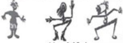
(છંદ : હરિવોતિહ)

यो चित्तं निव मे मिर भये, तिन अकय जो मानन्द लह्यो ।