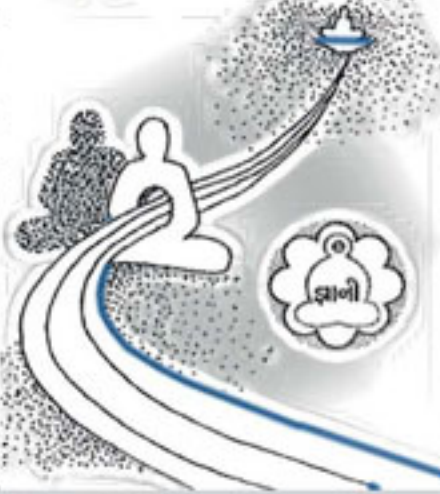
પ્રકરણ : ૨૮ : દુઃખ-સુખનું લક્ષણ અને તેનું મૂળ કારણ

આ જીવ દુઃખ ટાળવાનો અને સુખ મેળવવાનો ઉપાય નિરંતર કરતો રહે છે. પણ તેના બધાં ઉપાયો જૂઠા હોય છે. શરીરનું દુઃખ ઔષધિથી, મનનું દુઃખ મનોરંજનથી, દરિદ્રતાનું દુઃખ ધનાકિથી અને અન્ય પ્રતિકૂળતાના દુઃખ અનુકૂળતાથી ટળતા હોય તો આ ઉપાય સાચા કહેવાય. પણ આવાં ક્યારેય ખનતું નથી. વળી પોતે જેને સુખ માને છે તે અરેખર સુખ હોય તો સુખનો સરવાળો પણ સુખ હોય અને તેના પ્રત્યે ક્યારેય અણગમો ન થાય. એક છાડવો ખાવામાં સુખ હોય તો એકવીસ ખાવામાં વધુ સુખ થવું જોઈએ. પણ તેમ થતું નથી અને તેના પ્રત્યે અણગમો જ થાય છે. આ રીતે દુઃખ ટાળી સુખ મેળવવાના સઘળા ઉપાય જૂઠા છે. તેથી દુઃખ-સુખનું