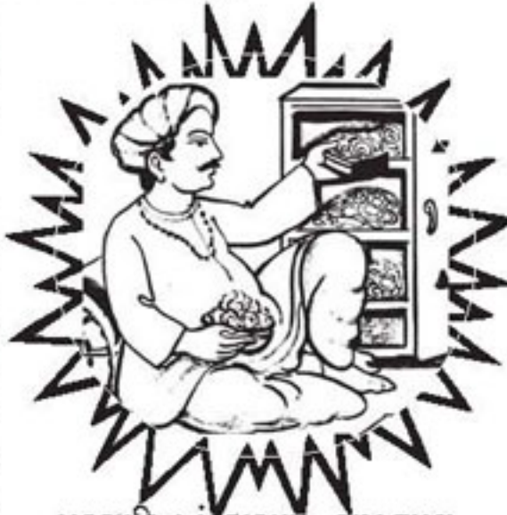
પરચારિત્રનું કારણ : રાગભાવ

પરહૃત્ય પ્રત્યે રાગ તો અંસારઠારહ્યા છે ખરે; તેટી શ્રમણા કિત્યે ઠરો લિજભાવના સ્વાત્મા વિષે. ભાવાર્થ : ખરેખર પરહૃત્ય પ્રત્યેનો રાગ જ સઘળાં સંસાર અને તેના દુઃખોનું કારણ છે. તેથી શ્રમણો પોતાની પરિણતિ પોતાના શુદ્ધ સ્વરૂપમાં જ સ્થિત રાખવાની વીતરાગભાવની જ ભાવના નિરંતર રાખે છે. (મોક્ષપાઠુડ : ગાથા ૭૧)