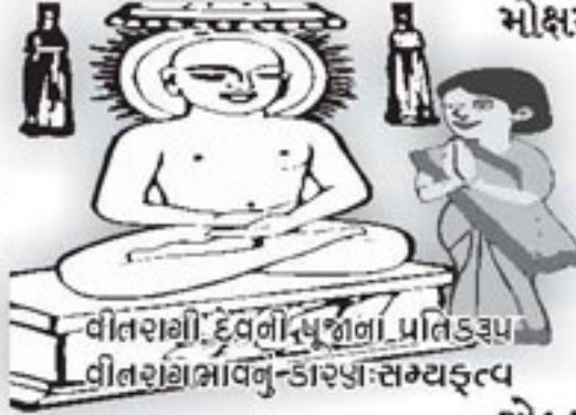
વીતરાગી દેવળી સુખની પ્રાપ્તિરૂપ વીતરાગીભાવનું-કારણ-સમ્યક્ત્વ

થતા જ્ઞાન અને ચારિત્ર પણ સમ્યક્ નામ પામે છે. તેથી સમ્યક્દર્શનમાં સમ્યક્દર્શન-જ્ઞાન-ચારિત્રરૂપ સમ્યક્ત્વનો પણ સમાવેશ છે. આ સમ્યક્દર્શનથી જ