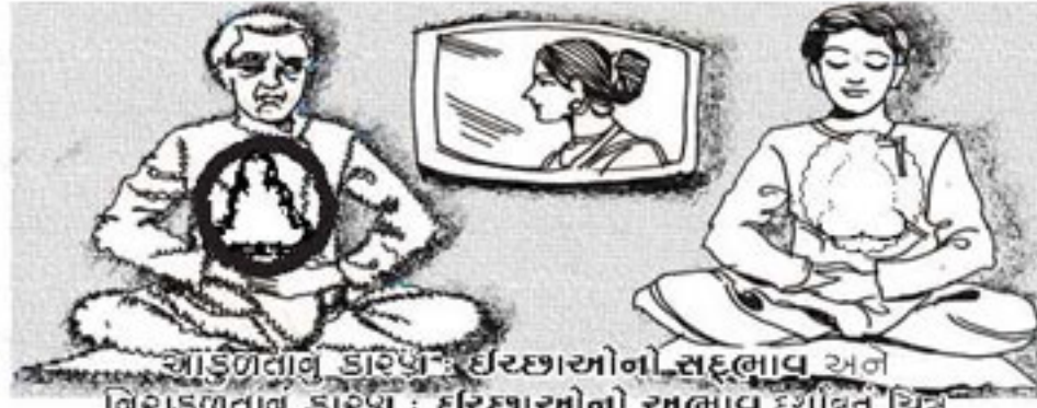
આકુળતાનું કારણ : ઈચ્છાઓનો સદ્ભાવ અને નિરાકુળતાનું કારણ : ઈચ્છાઓનો અભાવ દર્શાવતું ચિત્ર.

સમજૂતી : પરમાંથી સુખ મેળવવા પરવિષયો પ્રત્યેના પ્રયોજનના કારણે થતી પરપરિણતિ એ જ ઈચ્છા છે. જેટલા પ્રકારે પરવિષયોનું પ્રયોજન હોય તેટલા પ્રકારની ઈચ્છાઓ હોય છે. પરવિષયો પ્રત્યેની આસક્તિ અનુસાર ઈચ્છાઓની તીવ્રતા હોય છે. પાંચ ઈન્દ્રિયો સંબંધી પરવિષયો માત્ર પાંચ પ્રકારના નથી. પણ એક એક ઈન્દ્રિય સંબંધી પરવિષયો અનેક પ્રકારના હોય છે. તેથી એક એક ઈન્દ્રિયવિષય સંબંધી ઈચ્છાઓ પણ અનેક પ્રકારની હોય છે. ઈચ્છાઓના સદ્ભાવના કારણે આકુળતા હોય છે.