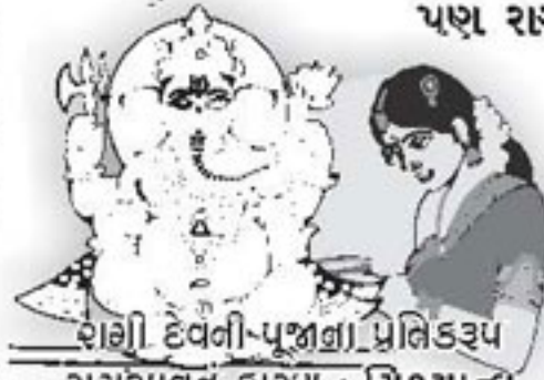
રાણી દેવળી-પૂજારી પ્રતિકરણ રાગભાવનું કારણ : મિથ્યાત્વ

સંસારદુઃખ અને મોક્ષસુખ વિભાગ : ૭ : સાચા સુખની પ્રાપ્તિનો ઉપાય