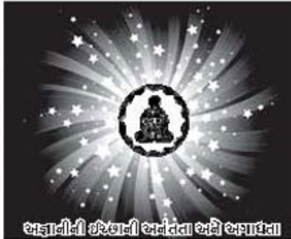
અજ્ઞાનીની ઈચ્છાની અનંતતા અને અગાધતા

જ્યારે જેની ઈચ્છા હોય છે ત્યારે તેનો ભોગવટો હોતો નથી. જ્યારે જેનો ભોગવટો હોય છે ત્યારે તેની ઈચ્છા હોતી નથી. આ રીતે ઈચ્છા અને ભોગવટામાં સમયભેદ હોય છે. ઈચ્છાનુસારનો ભોગવટો બંને ત્યારે ઈચ્છાનો ભાવ વિણાસી જાય છે. તો ઈચ્છા વિના ભોગવટો શા કામનો ? ફરી જ્યારે ઈચ્છા ઉત્પન્ન થાય છે ત્યારે ભોગવટાનો ભાવ વિણાસી જાય છે તો ભોગવટા વિનાની ઈચ્છા શું કામની ? કાંઈ કામની નથી. ખાવાની ઈચ્છા હોય, ભૂખ ઘાગી હોય અને ખાવાનું મળે તો ઈચ્છાનું સાધન કહેવાય. પણ ખાવાની ઈચ્છા જ ન હોય, ભૂખ ઘાગી જ ન હોય અને ખાવતા