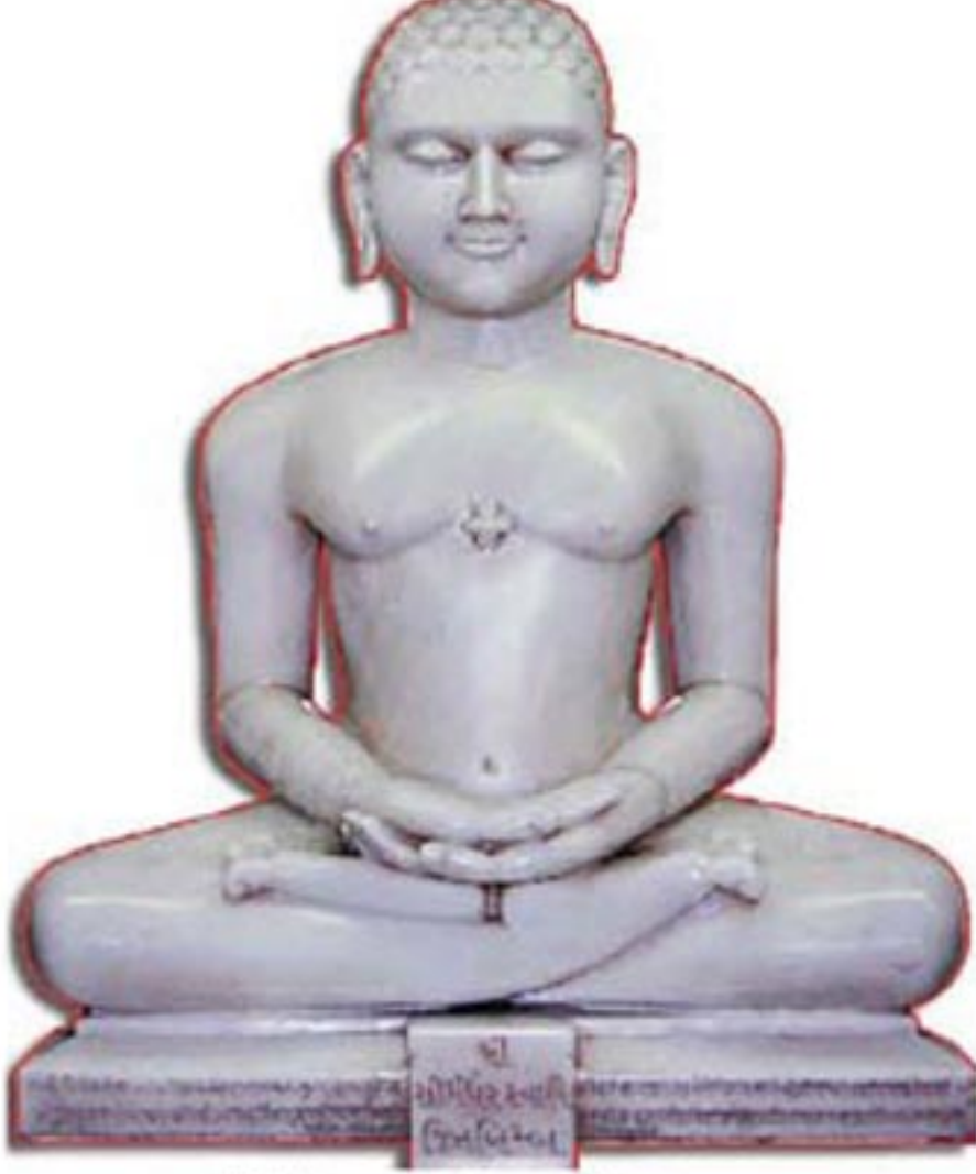
સીમંધર ભગવાન, સોનગઢ. (સવૈયા એક્ટ્રીસા)

કેઈ ઉદાસ રહે પ્રમુ કારન, કેઈ કહે ઉઠિ જાંદિ કહીકૈ । કેઈ પ્રનામ કરૈ ગઠિ મૂરતિ, કેઈ પહાર ચઠે ચઠિ છીકૈ ॥ કેઈ કહે આસમાનકે ઉપરિ, કેઈ કહે પ્રમુ હેઠિ જમીકૈ । મેરા ધની નહિ દૂર દિસન્ટર, મોહિમે હૈ મોહિ સૂઝત નીકૈ ॥